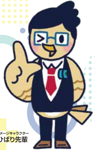
イメージキャラクター ひびり先輩

お客さまが保有している取引先への「 売掛債権 」や、商品・製品・原材料等の「 棚卸資産 」を担保として、金融機関から融資を受けることができる保証制度です。不動産担保を提供することが難しい方でも、資金調達の幅が広がります。 なお、本制度は、 連帯保証人不要 でご利用いただけます。