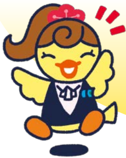
イメージキャラクター ひよこ

中小企業の皆様の資金調達にあたって、 保証協会と金融機関が 連携・協調することで借入枠の拡大を図り、 事業の発展を応援します。