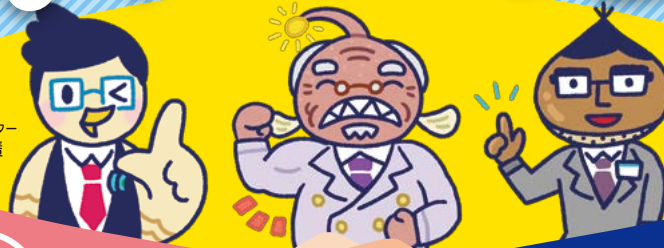
イメージキャラクター ひばり先輩