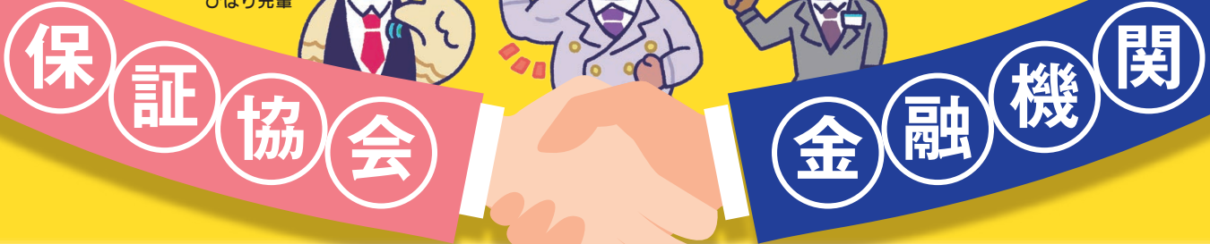
イメージキャラクター ひばり先輩