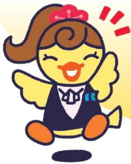
イメージキャラクター ひよこ

中小企業の皆様の資金調達にあたって、 保証協会と金融機関 が 連携・協調することで借入枠の拡大を図り、 事業の発展を応援します。