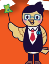
イメージキャラクター ひばり先輩