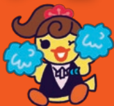
イメージキャラクター ぴよこ