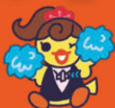
イメージキャラクター ぴよこ