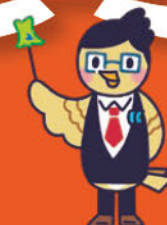
イメージキャラクター ひばり先生