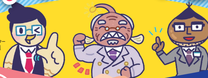
イメージキャラクター ひばり先輩