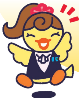
イメージキャラクター ひよこ

中小企業の皆様の資金調達にあたって、 保証協会と金融機関が 連携・協調することで借入枠の拡大を図り、 事業の発展を応援します。