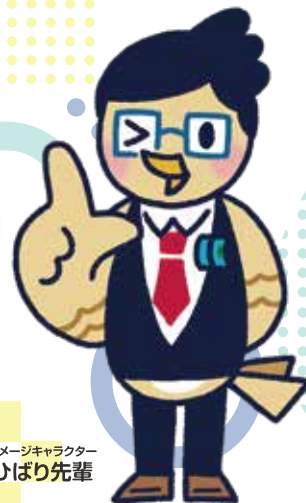
イメージキャラクター ひぼり先輩

お客さまが保有している取引先への「 売掛債権 」や、商品・製品・原材料等の「 棚卸資産 」を担保として、金融機関から融資を受けることができる保証制度です。不動産担保を提供することが難しい方でも、資金調達の幅が広がります。 なお、本制度は、 連帯保証人不要 でご利用いただけます。