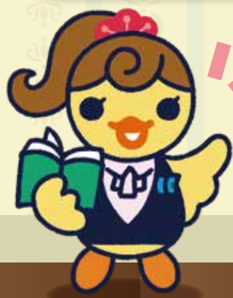
イメージキャラクター ぴよこ