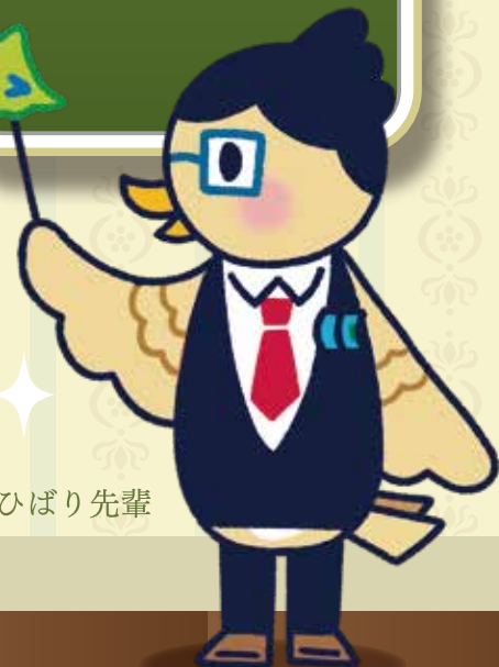
イメージキャラクター ひばり先輩